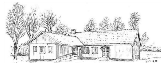
Bolmsö Bygdegård Sjöviken